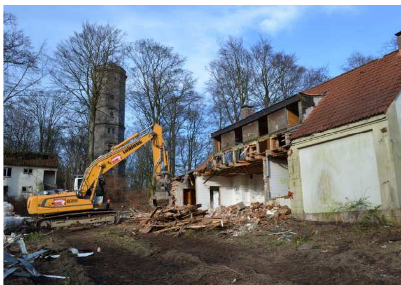
Abbrucharbeiten am Bungsberg

Vor diesem Hintergrund konnten in 2012 sowohl die vorhandenen Altgebäude (Gaststätte, Schuppen und „Betriebsgebäude“ am Elisabethturm“) abgebrochen wie auch mit dem Beginn der Profilierungsarbeiten begonnen werden.